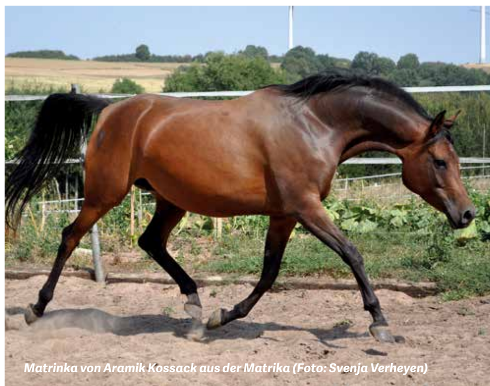
Matrinka von Aramik Kossack aus der Matrika

Die Stammstuten Majmakala von Balaton, Matrika und Marenah (von Pomarval) und Karmen (von Kubinec) prägten diese Zuchtstätte. Als typische Vertreterin der russischen Blutlinien brachte Matrika zuverlässig und unkompliziert Jahr für Jahr ein Fohlen zur Welt, wobei ihre Nachkommen in ihrer Rittigkeit besonders geeignet für