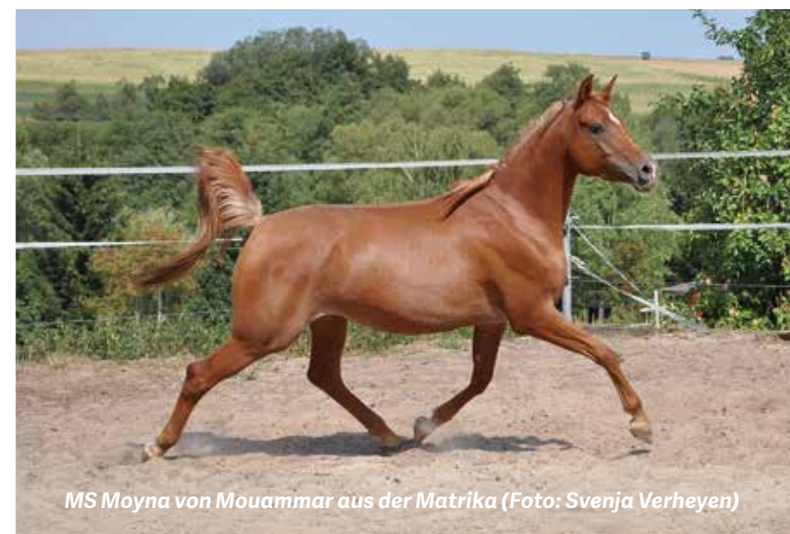
MS Moyna von Mouammar aus der Matrika