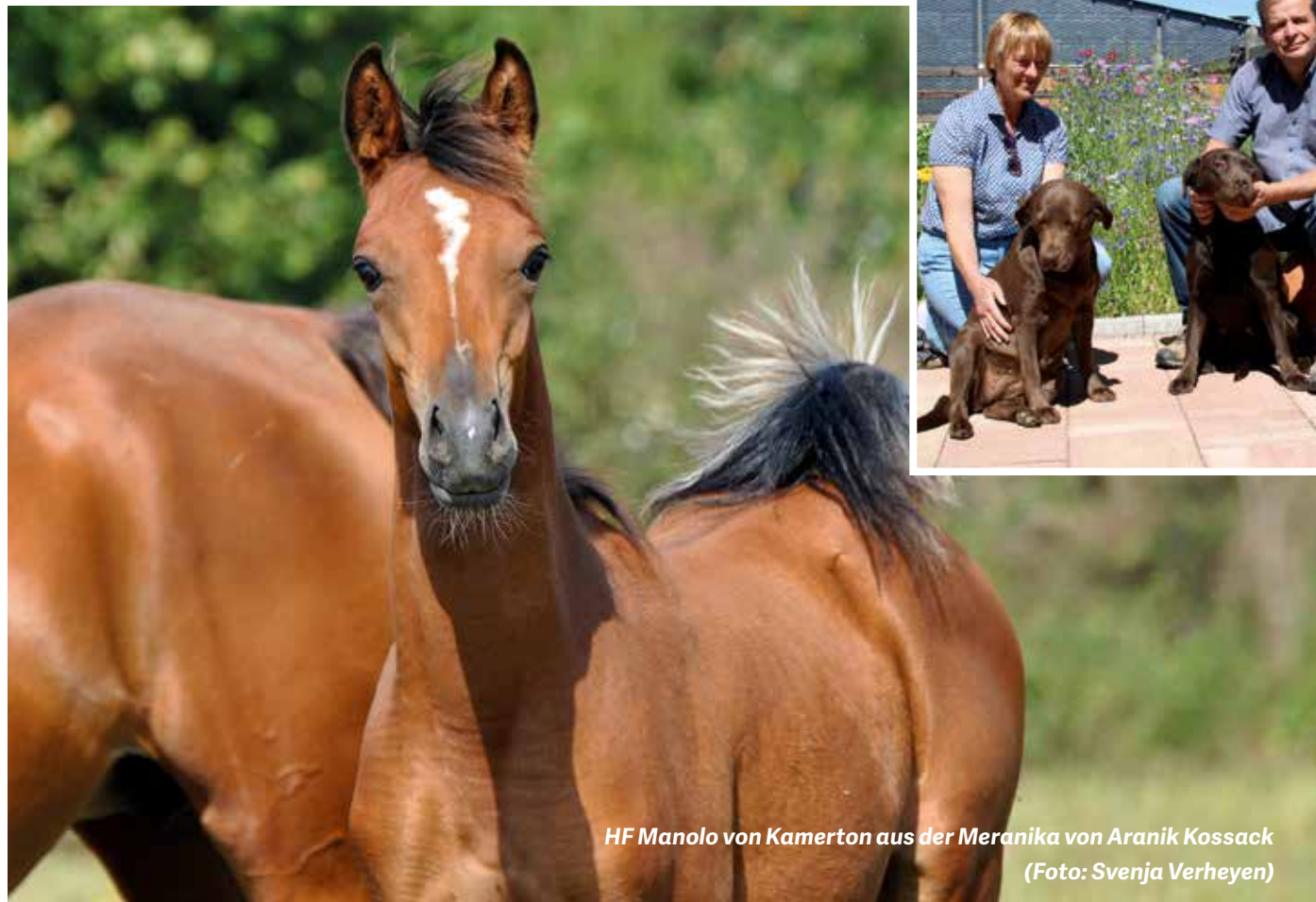
HF Manolo von Kamerton aus der Meranika von Aranik Kossack